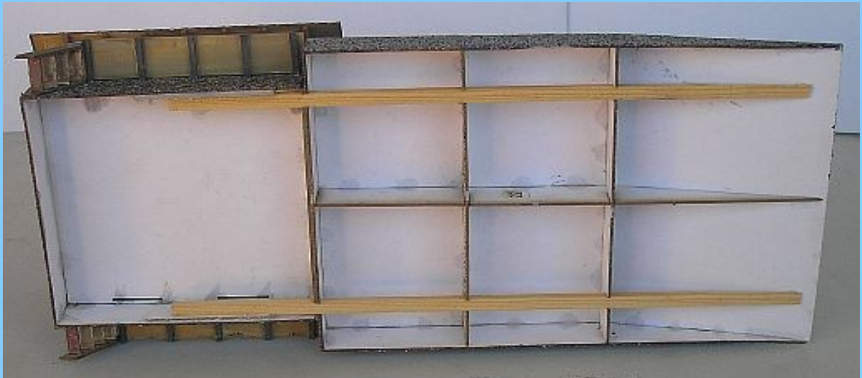
Spojení budovy skladu se sestavenou rampou pomocí smrkových nosníků.