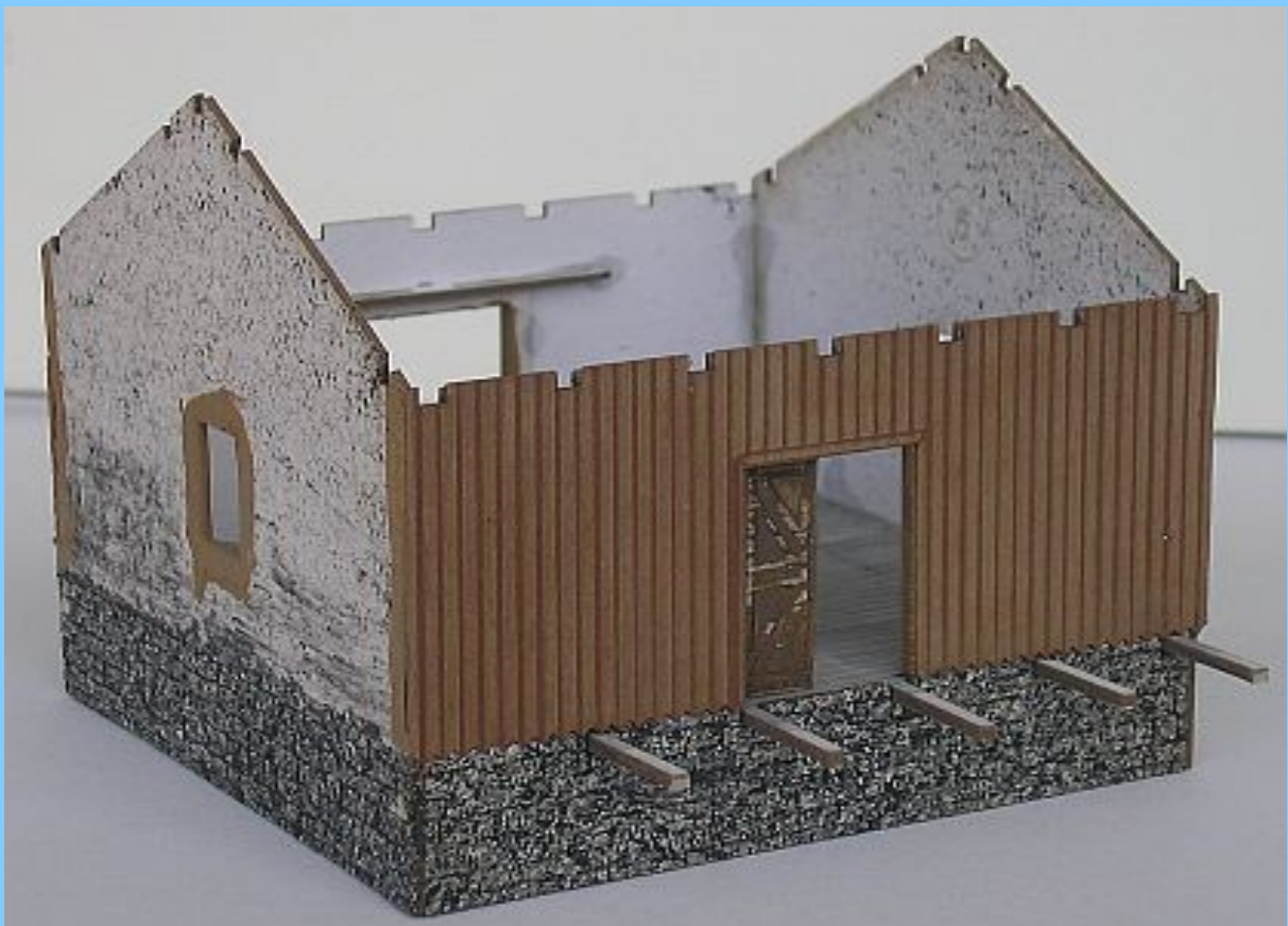
Instalace dřevěného obložení stěn. Dveře nasunout do otvoru v podlaze a pak do otvoru ve vodící liště, zvrchu na ně opatrně přilepit zarážku, osadit madla z drátku.