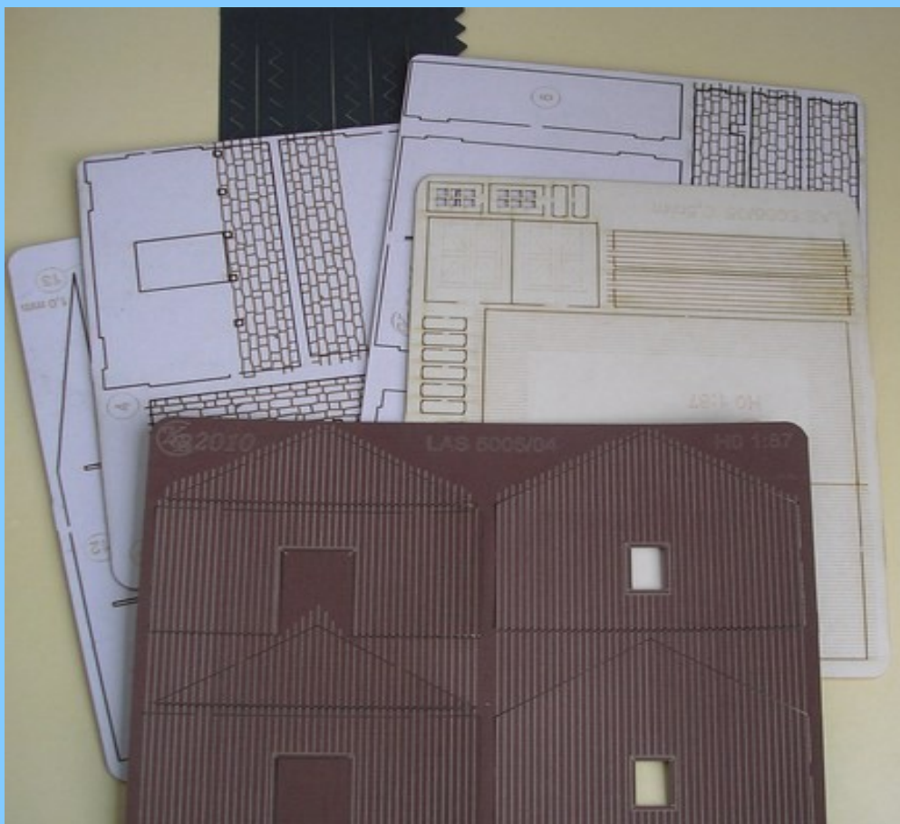
Po vybalení ze sáčku. Některé díly je potřeba barvit ještě před sestavením modelu.