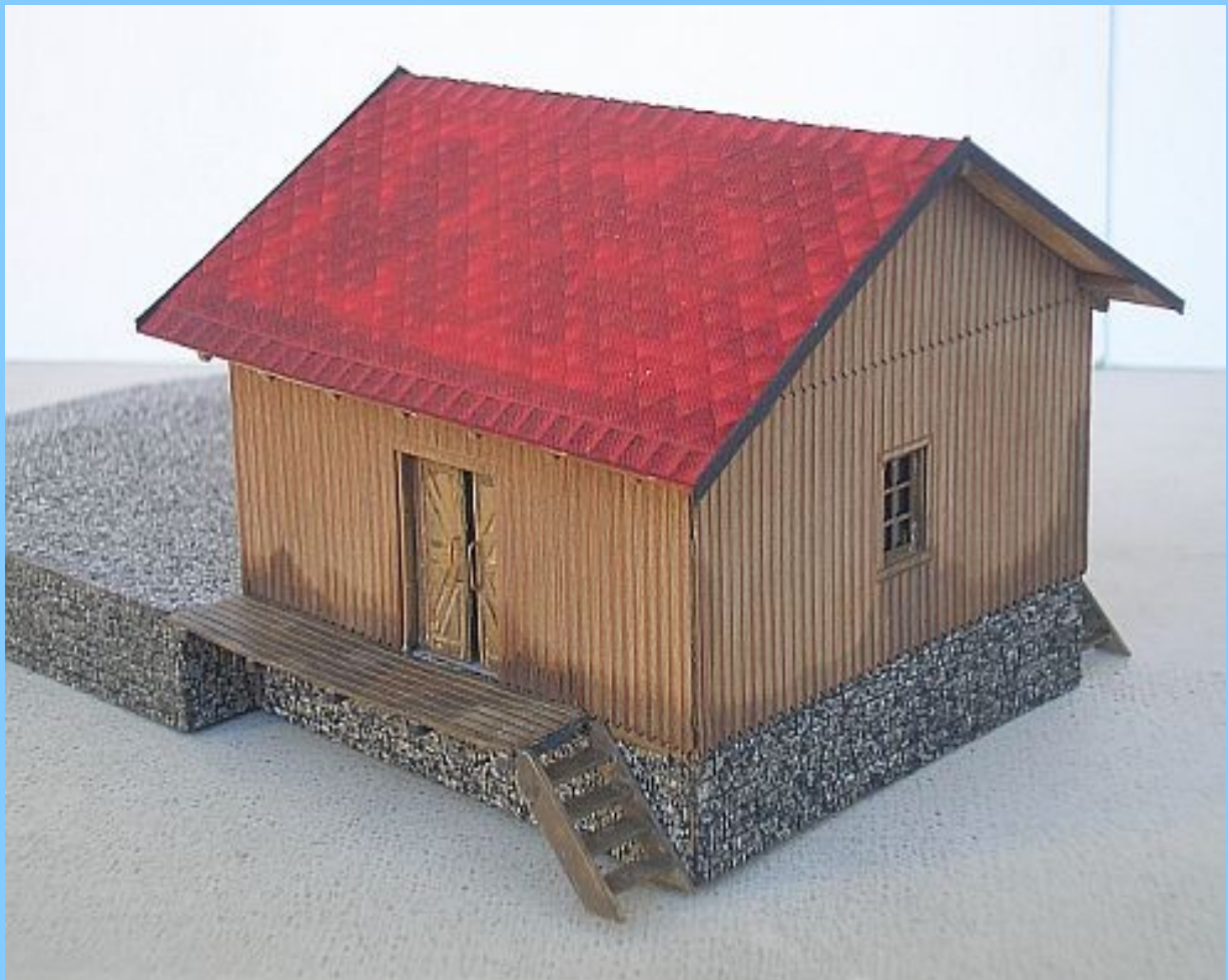
Umístění nabarvených lávek a dřevěných schodů k nim. Položení střechy, návětrné lišty z proužku kartonu. Mírná patinace lihovými barvami.