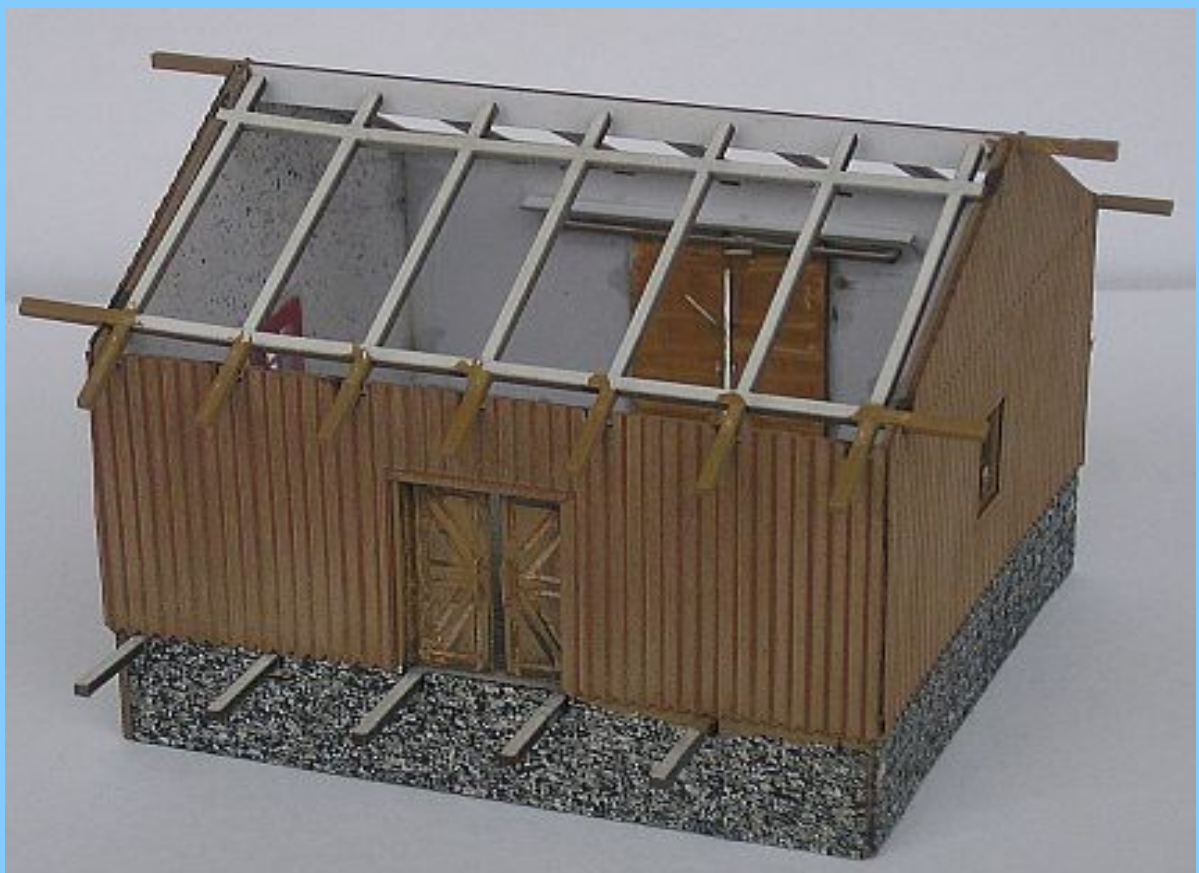
Po usazení dveří osadit zvrchu nad vodící lištu krycí lištu, která zabraňuje vysazení dveří.