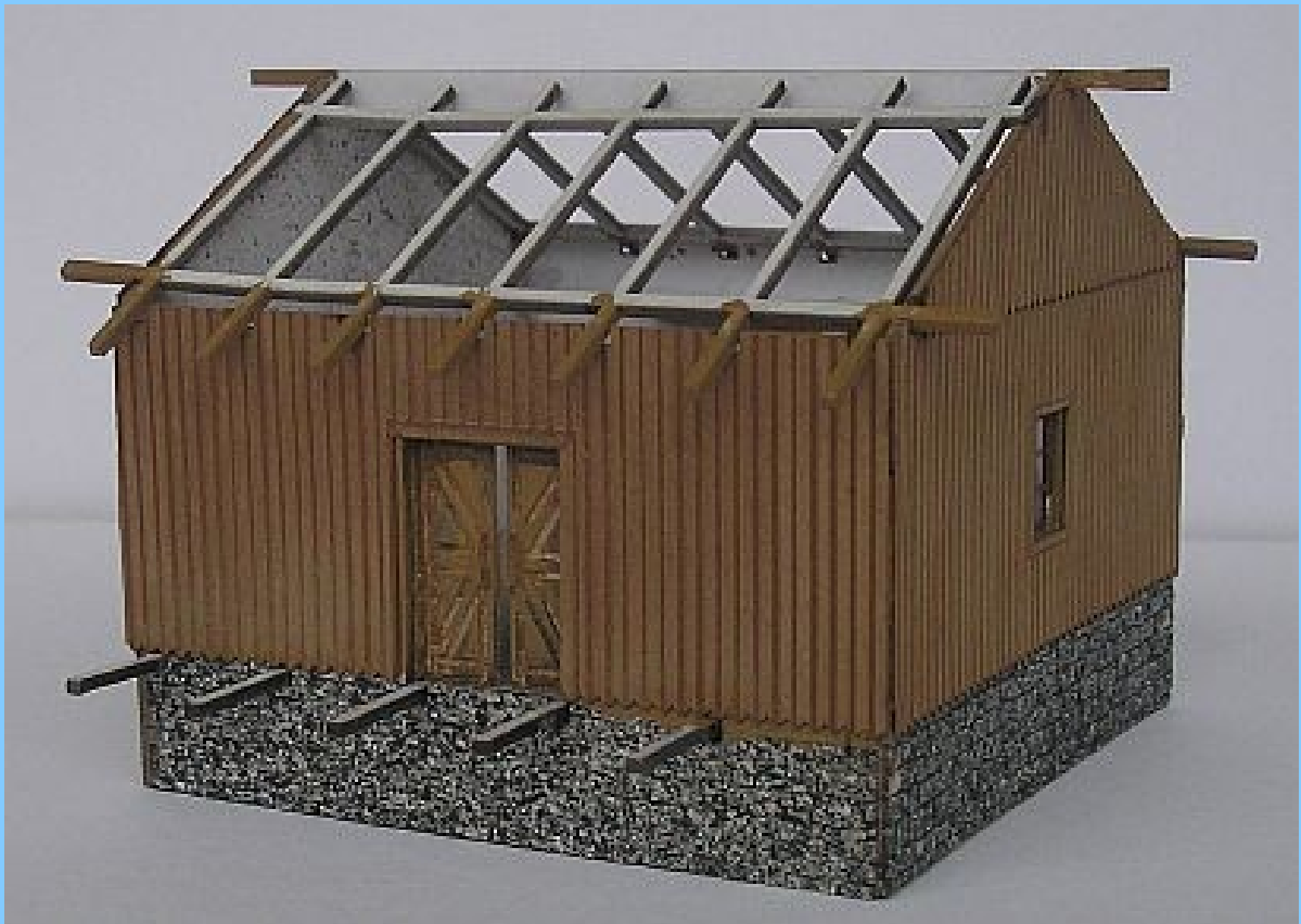
Před umístěním konstrukce střešních krovů je třeba osadit dveře a zasklená okna.