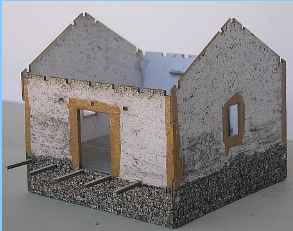
Základní sestava – navléknout trámký podlahy do bočních stěn, vlepit štitové stěny a nabarvit rohy a rámy dveří a oken.