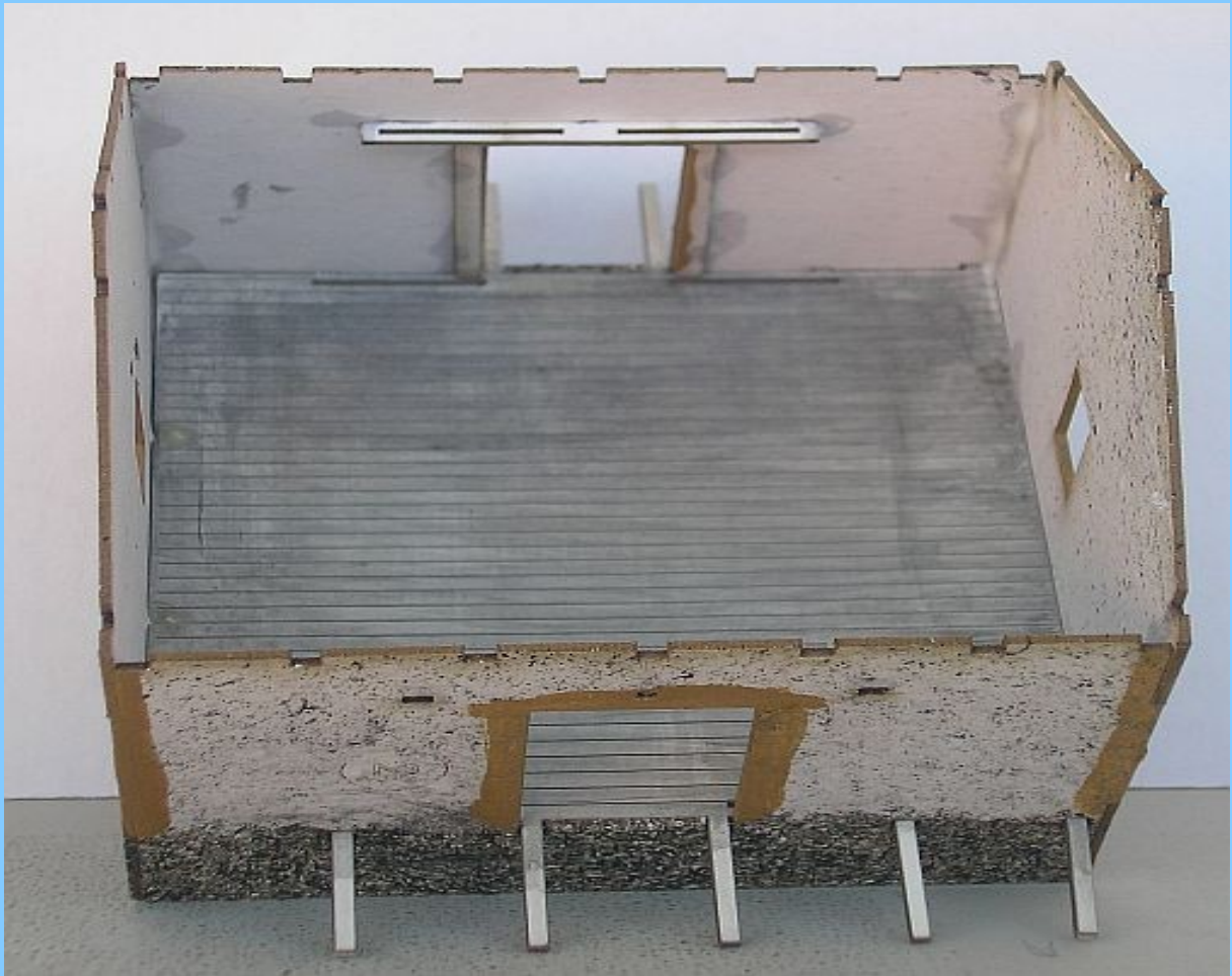
Správné umístění vodící lišty dveří.